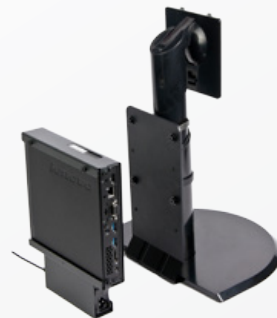
ThinkCentre® Tiny L-Halterungs-Montagekit (0B47373)