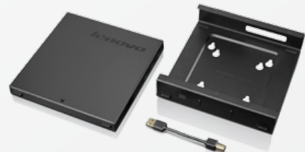
ThinkCentre Tiny Erweiterungseinheit (0B47375) ThinkCentre Tiny VESA-Montagehalterung (0B47374)