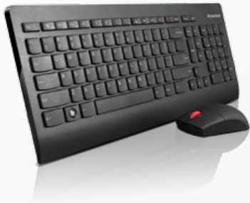
Ultraflache Lenovo® Wireless-Tastatur- und Mauskombination (0A340xx)