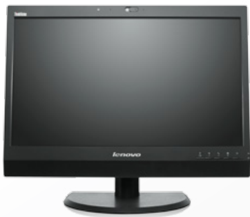
ThinkVision® LT2323z Monitor