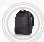
ThinkPad Professional Rucksack