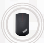
ThinkPad Precision kabellose Maus