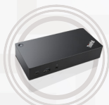
ThinkPad Thunderbolt 3 Andockstation